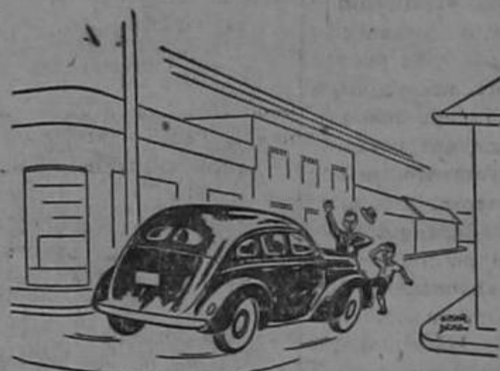
Responsabilidad Civil por atropello a personas