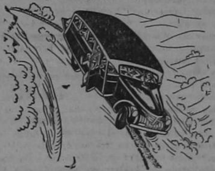
Responsabilidad por la muerte de pasajeros